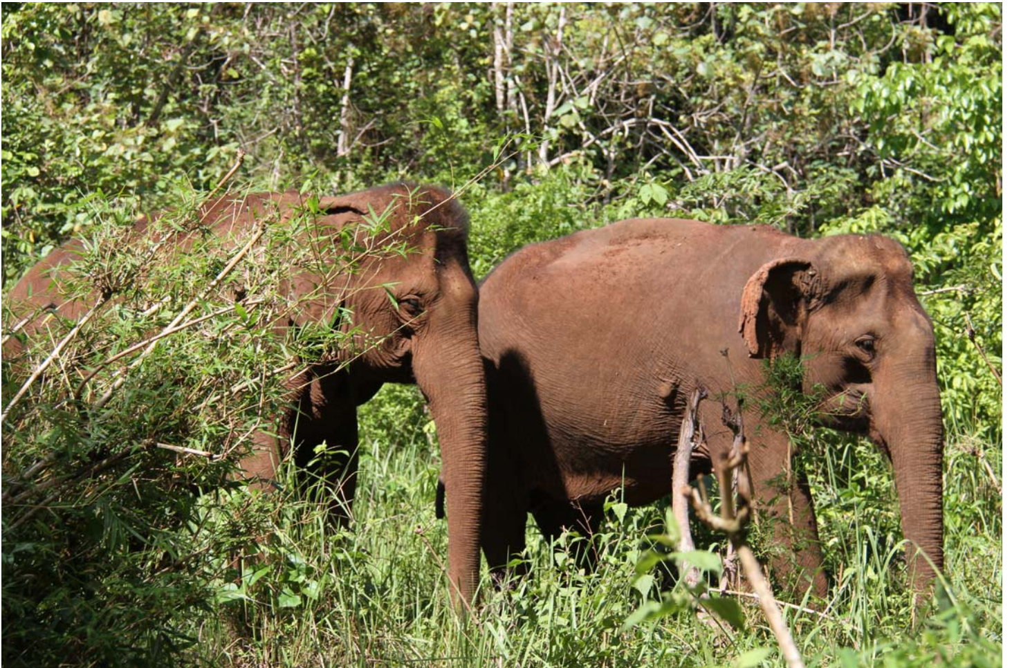
សត្វដំរីដែលជាប្រភេទសត្វងាយរងគ្រោះថ្នាក់ជិតផុតពូជកំពុងរស់នៅក្នុងតំបន់ព្រៃការពារកែវសីម៉ាក្នុងខេត្តមណ្ឌលគិរី។

តំបន់ព្រៃការពារភាគឥសាន្តៈ គ្របដណ្តប់លើផ្ទៃដីទំហំជាង៣០.០០០គីឡូម៉ែត្រការ៉េនៅភាគឥសាន្តនៃប្រទេសកម្ពុជា។ តំបន់នេះគឺជាផ្នែកមួយនៃព្រៃល្បោះតំបន់មេគង្គប៉ែកខាងក្រោម និងជាបណ្តុំព្រៃល្បោះធំជាងគេបង្អស់មួយនៅក្នុងតំបន់អាស៊ីអាគ្នេយ៍។ ជាមួយភាពចម្រុះនៃទីជម្រកដ៏ធំទូលាយ រាប់ចាប់តាំងពីព្រៃស្រោងតំបន់ភ្នំហួតដល់ព្រៃល្បោះ តំបន់ព្រៃការពារភាគឥសាន្តបានគាំទ្រដល់ការរស់នៅរបស់សត្វប្រភេទងាយរងគ្រោះថ្នាក់ជិតផុតពូជដូចជា ដំរី ខ្លាធំ ខ្លាខ្លី ខ្លាពពក ឆ្កែព្រៃ ក្របីព្រៃ ប្រើស ក្រពើភ្នំ និងរមាំងជាដើម។ ព្រៃតំបន់នេះក៏ជាទីជម្រកដ៏សំខាន់របស់សត្វស្លាបធំៗប្រភេទងាយរងគ្រោះថ្នាក់ជិតផុតពូជ និងកំពុងរងការគំរាមកំហែងព្រមទាំងជាទីជម្រករបស់សត្វទន្សោងដែលមានចំនួនច្រើនជាងគេបង្អស់នៅលើពិភពលោក។ ក្រុមអ្នកជំនាញសត្វខ្លាជឿថាតំបន់នេះមានសក្តានុពលខ្ពស់សម្រាប់ការស្តារឡើងវិញនូវចំនួនសត្វខ្លាធំដោយសារតែវិសាលភាពដ៏ធំធេងនៃព្រៃជាទីជម្រក និងការកើនឡើងនៃចំនួនសត្វជាចំណី។ ជាងនេះទៅទៀត ជនជាតិដើមភាគតិចជាច្រើនក៏កំពុងរស់នៅ និងពឹងអាស្រ័យយ៉ាងខ្លាំងលើផល និងអនុផលព្រៃឈើតំបន់នេះសម្រាប់អាហារប្រពៃណី វប្បធម៌ និងប្រាក់ចំណូលផងដែរ។