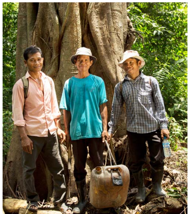
ជនជាតិដើមភាគតិចពង្រឹង កំពុងរស់នៅពឹងអាស្រ័យលើព្រៃឈើសម្រាប់ការចិញ្ចឹមជីវិត និងប្រាក់ចំណូល។

៣. ធានាថាការគ្រប់គ្រងតំបន់ដែលស្ថិតនៅក្រៅព្រៃការពារដែលបានស្នើឡើង ឆ្លុះបញ្ចាំងអំពីវិធីសាស្ត្រគ្រប់គ្រងជ្រោយដើម្បីធានាសិទ្ធិកាន់កាប់ដីធ្លីសម្រាប់សហគមន៍មូលដ្ឋាន និងសិទ្ធិលើធនធានព្រៃឈើសម្រាប់ការគ្រប់គ្រងព្រៃឈើប្រកបដោយនិរន្តរភាព។