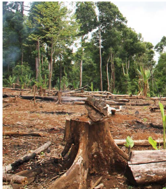
ការកាប់គ្រុឌដីព្រៃនៅតំបន់ព្រៃការពារភាគឥសាន្ត។

នៅក្បែរតំបន់អភិរក្សទាំងនេះ។ សកម្មភាពជាបឋមរបស់គម្រោងគាំទ្រព្រៃឈើ និងជីវចម្រុះនៅតំបន់ព្រៃការពារភាគឥសាន្ត គឺរៀបចំនូវប្រព័ន្ធគ្រប់គ្រងប្រកបដោយប្រសិទ្ធភាព និងបង្កើនឲ្យបានជាអតិបរមានូវផលប្រយោជន៍សម្រាប់ការចិញ្ចឹមជីវិតរបស់ប្រជាជនសហគមន៍នៅក្នុងតំបន់ព្រៃការពារភាគឥសាន្តនេះ។