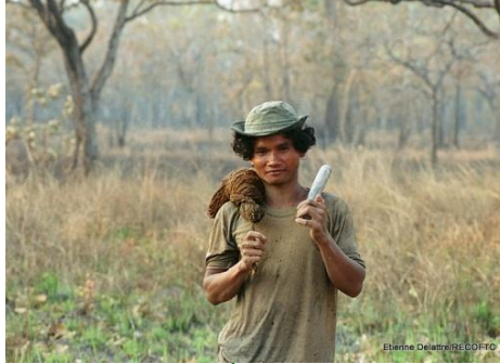
ទិន្នន័យសង្ខេប

តើសមធម៌ក្នុងការកាត់បន្ថយការប្រែប្រួលអាកាសធាតុនៅក្នុងវិស័យព្រៃឈើគឺជាអ្វី? សូមចែករំលែកមកយើងវិញនូវចម្លើយរបស់អ្នក ឬផ្តល់យោបល់កែលម្អចំពោះនិយមន័យរបស់ GREEN Mekong ហើយយើងនឹងចុះផ្សាយចម្លើយរបស់អ្នកនៅក្នុងវេបសាយរបស់យើង។ វិភាគទានដែលល្អជាងគេនឹងមានចុះផ្សាយនៅក្នុងព្រឹត្តិបត្រព័ត៌មានលេខបន្ទាប់របស់យើង។ សូមអ៊ីម៉ែលមកយើងតាមអាស័យដ្ឋាន៖ green.mekong@recoftc.org .